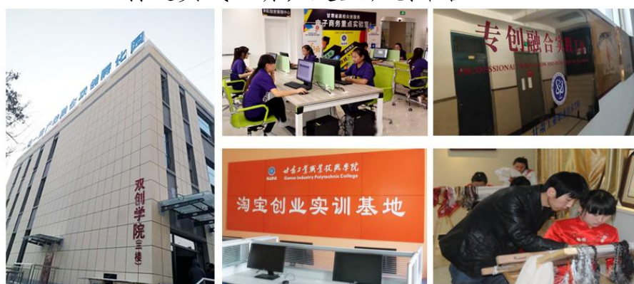
图 2：创新创业实践基地

一是夯实双创基础、投入持续跟进。学校提出了两个保障：一是场地保障，提供校内双创基地 5500 平方米；二是经费保障。二是建设共享开放实践平台。学校建有“一带一路产教融合双创孵化园”、“一带一路产教融合创业园”、“专创融合实践工坊”、“虚拟仿真创新实训基地”四大创新创业平台；与国家级众创空间“天水 66 号文化创意园”、“天水市众创空间”、“供应链协同创新中心”、三和数码城市三维大数据中心，等合作共建校外双创基地；与阿里、京东联合打造了电商创业实践项目、与华为共建产教融合 ICT 实践项目，平台和项目用于双创成果转化。学校签订了《库尔勒经济开发区与甘肃工业职业技术学院校政合作框架协议》，共建“一带一路产教融合联盟”。