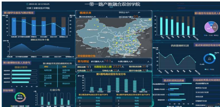
图 4：创业就业孵化大数据

新意识和创业能力培养，毕业生以其优良的素质、扎实的专业技术基础和娴熟的职业岗位技能深受用人单位的欢迎和好评，近三年毕业生就业率在 90%以上，建档立卡学生就业率达 99.06%。