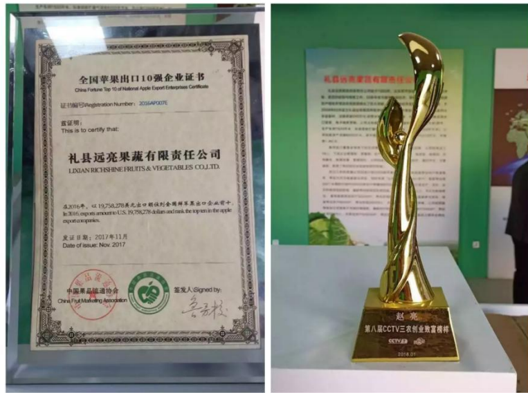
图 5：赵亮荣获 2018 年第八届 CCTV 三农创业致富青年称号

二是学生创业投身反哺脱贫人数多，效果明显，社会责任感强。我校 86% 的自主创业学生选择扎根陇原创业。我校毕业生赵亮，把天水、陇南的优质苹果送到了“一带一路”沿线国家及东南亚、欧洲、非洲等十余个国家和地区，2018 年创汇收入 3000 多万美金，实现了集传统外贸、跨境电商、国内电商为一体的互补经营，及时拓宽了苹果销售渠道，帮助农户脱贫致富。赵亮荣获 2018 年第八届 CCTV 三农创业致富青年称号；2013 级甘南籍藏族毕业生杨家木江回乡创业，年营业额 500 多万，2018 年 7 月舟曲洪灾期间，捐助救灾物资，第一时间赶赴现场，发放救灾物资；2014 级电商“双创班”李杰龙双十一销售了 8000 多单产品，电商扶贫培训达 520 人。创业后参与带动区域精准扶贫创业培训的人数占总创业学生总数的 58%。近年来学生创业反哺脱贫培训人数达 3700 余人，助力多个乡村脱贫。我校毕业生创业事迹被媒体报道 36 次，阅读传播量达 33 万余次。