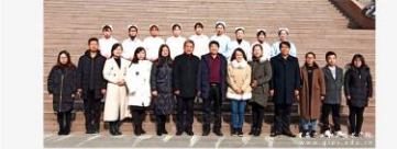
《供稿：旅游学院 摄影：李玉林 编审：李东哲》

为深化校企合作，产教融合，提升专业建设与人才培养质量，加强师资队伍建设，我校还与教育部“1+X”老年照护职业技能等级证书西安考评站签订了校企合作协议。我校将西安考评站特聘福利为老年服务与管理专业客座教授、聘请刘盼花、李玉林为老年服务与管理专业客座讲师。西安考评站特聘福利教师为西安考评站副站长，以考促教、定制培训、校企合作、形成合力，共同推进“1+X”证书制度试点工作，进一步提升学院人才培养质量，为建设中国特色高水平专业群助力，为职教改革打造大型工匠贡献力量。